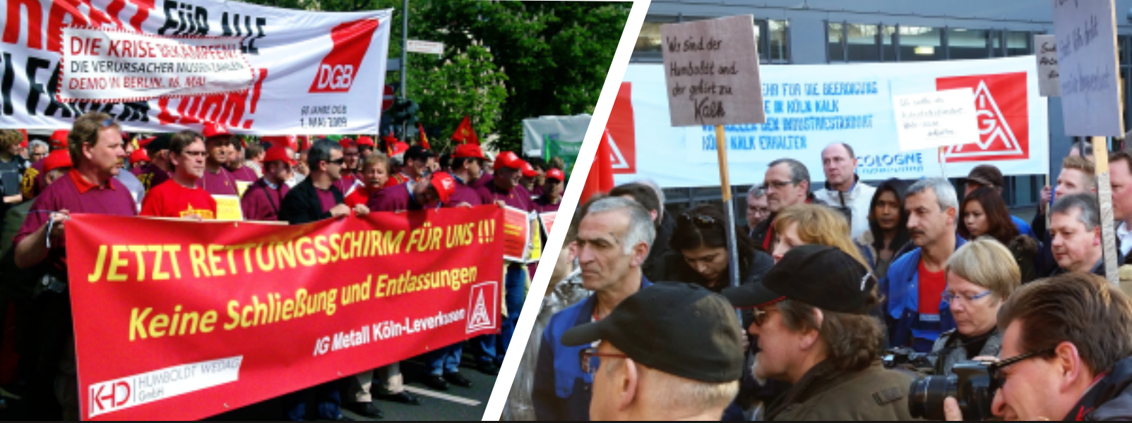
Protest gegen die drohende Vernichtung von Arbeitsplätzen in Kalk: Mai-Demo 2009 (damals noch als Teil von Humboldt-Wedag) und 2015 vor dem Kalker Bezirksrathaus.